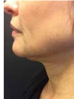
3 Monate nach der Behandlung