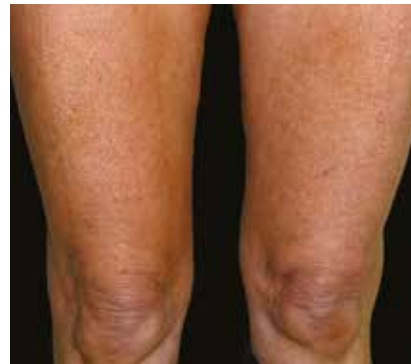
12 Monate nach der Behandlung