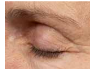
6 Monate nach der Behandlung