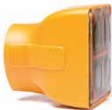
BODY TIP 16.0cm 2

Präzise, weniger tief in das Gewebe eindringende Thermalbehandlung von Falten in der periorbitalen Region und / oder am Augenlid selbst.