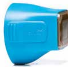
TOTAL TIP 3.0cm 2

Verstärkte Vibration für effektive 6 und schmerzreduzierte 4 Behandlungen am Körper