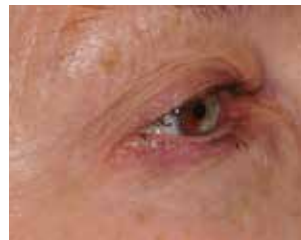
3 Monate nach der Behandlung