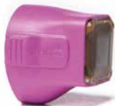
TOTAL TIP 4.0cm 2

Eine bis zu 25 % kürzere* Behandlungsdauer als mit dem Total Tip 3.0. Gezielte thermische Behandlung zur Therapie von Linien und Falten und Vibrationsfunktion für einen angenehmeren Behandlungsverlauf