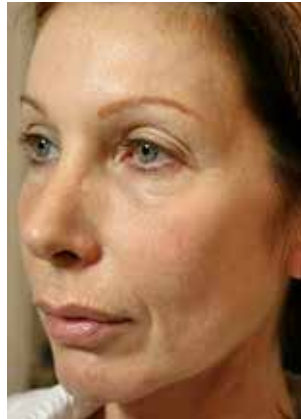
10 Monate nach der Behandlung