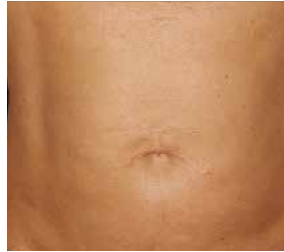
3 Monate nach der Behandlung