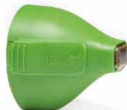
EYE TIP 0.25cm 2

Eine bis zu 25 % kürzere* Behandlungsdauer als mit dem Total Tip 3.0. Gezielte thermische Behandlung zur Therapie von Linien und Falten und Vibrationsfunktion für einen angenehmeren Behandlungsverlauf